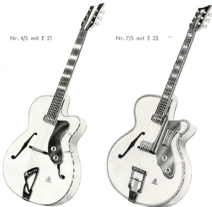
Nr. 7/S mit E 23