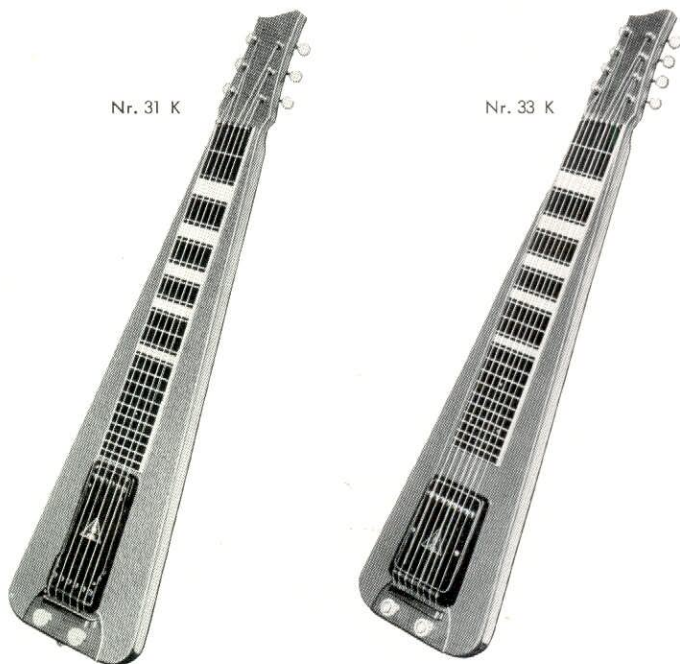
Nr. 33 K